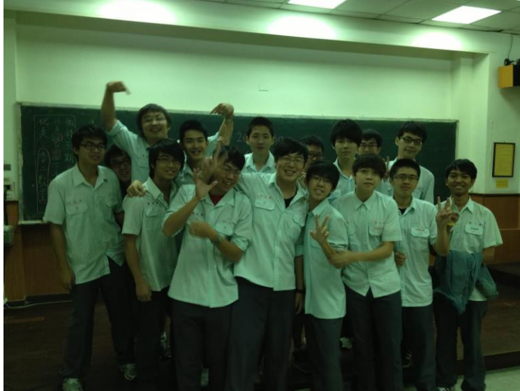
醫學系同學玩制服日

課重了些，把練琴的時間撥到功課一些，目前還算平衡得不錯。感覺最有趣的是看寄生蟲的卵，每個都長得很像，但要能辨別出種類，他說這跟研究音樂的思維一樣，是很精細的腦力判別過程，就是「從乏味中找些樂子來玩」，還真是調皮的大孩子一個。